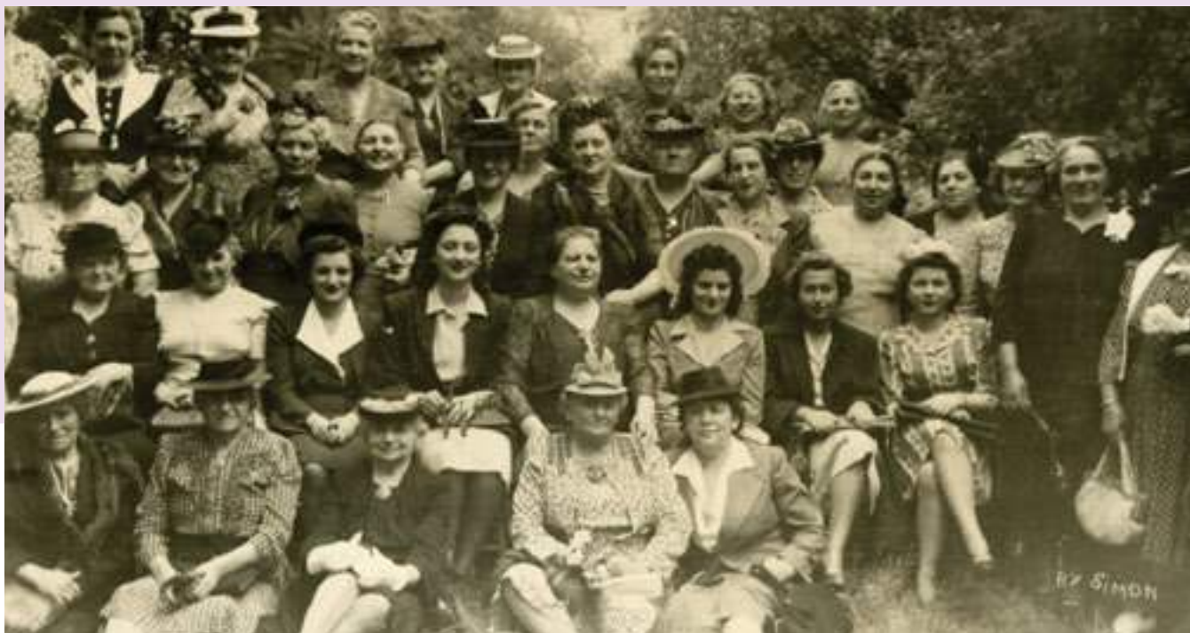
Les femmes du comité de l'hôpital Mont-Sinaï.