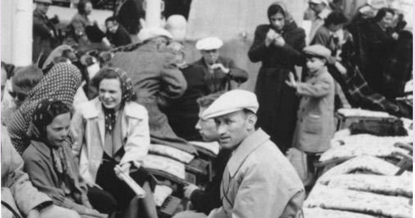
Des passagers sur le Saint-Louis .