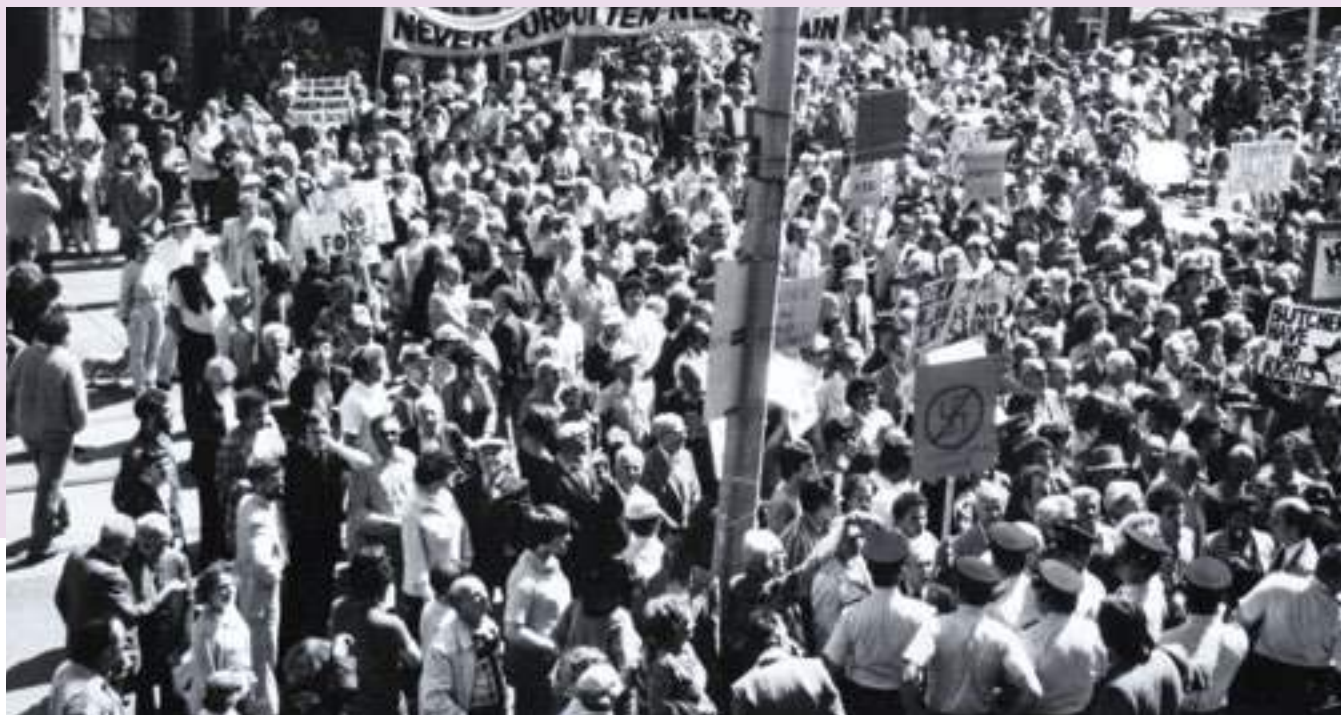
Manifestation antinazie devant la maison de Ernst Zündel. Carlton St., Toronto, 1981. Courtoisie de Ontario Jewish Archives, pièce 3076.